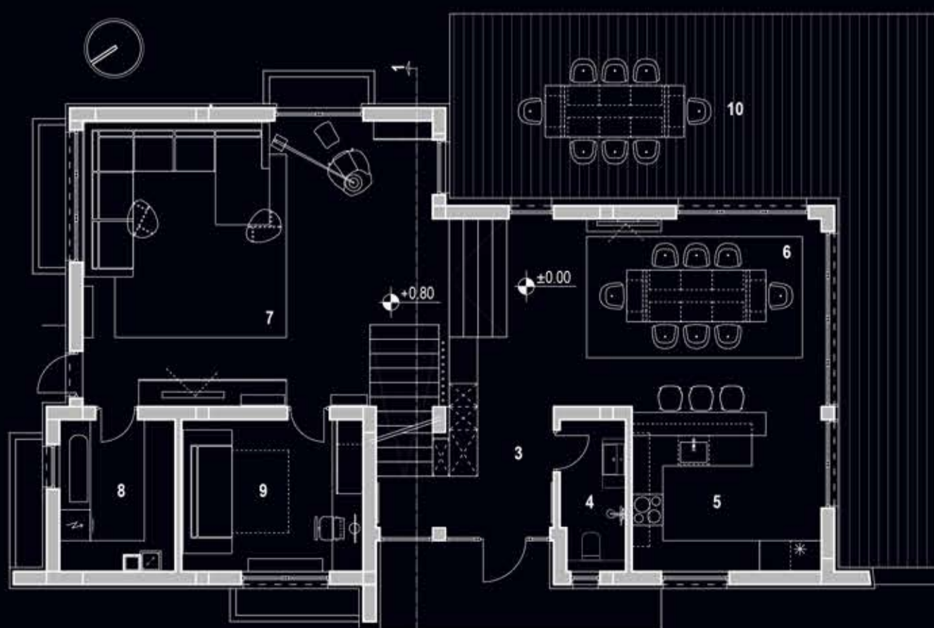
Разпределение приземен /първи/ етаж GROUND FLOOR

Тухлен зид // Brick wall Стенна/Бетонна конструкция // Nonload Concrete Гелекстриран стенова зид // Reinforced concrete wall