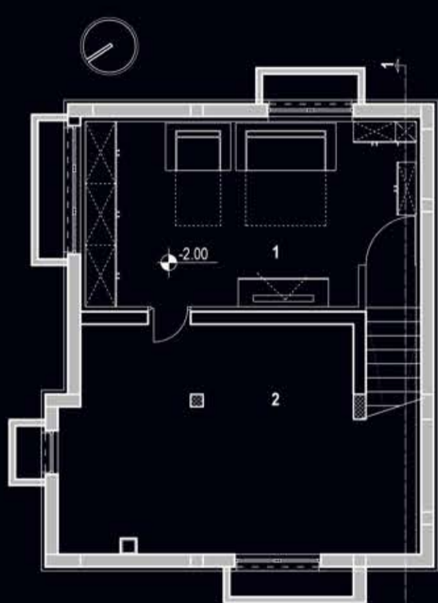
Разпределение подземен етаж UNDERGROUND FLOOR